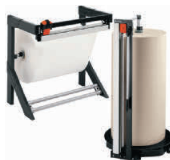
Schneidständer finden Sie auf Seite 745