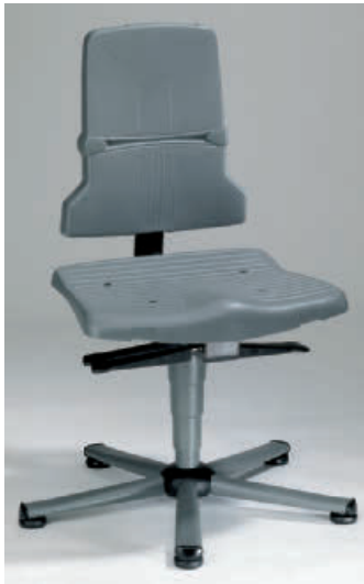
Kontakt-Rückenlehne und Sitzneigungsverstellung