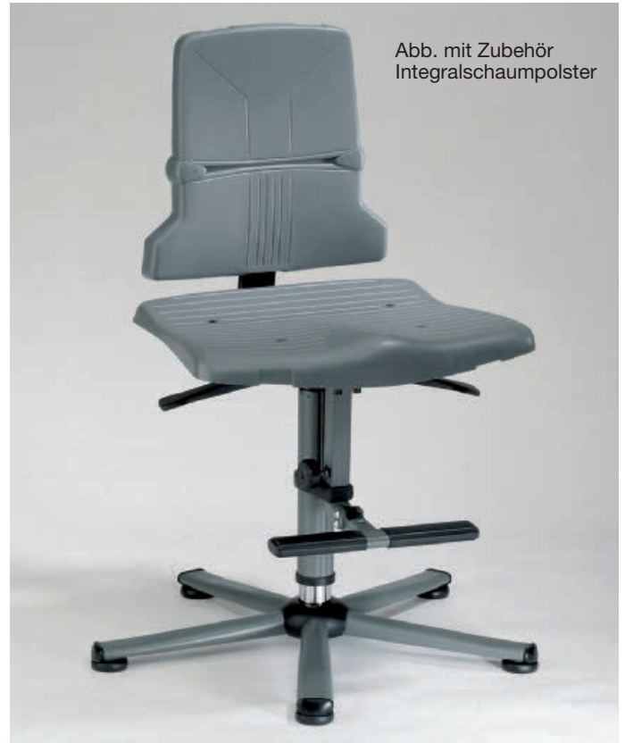
Abb. mit Zubehör Integralschaumpolster