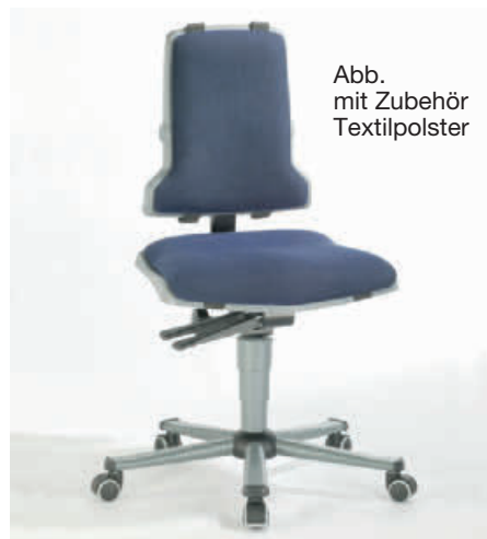
Abb. mit Zubehör Textilpolster