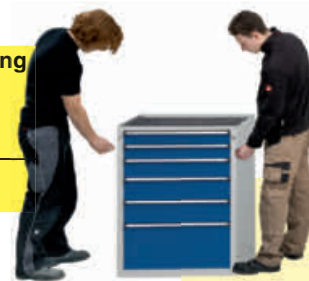
Ein Schrank für 2 Mitarbeiter