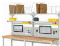
Abbildung zeigt Breite 2500 mm