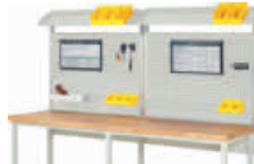
Abbildung zeigt Breite 2500 mm