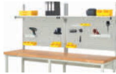
Abbildung zeigt Breite 2500 mm