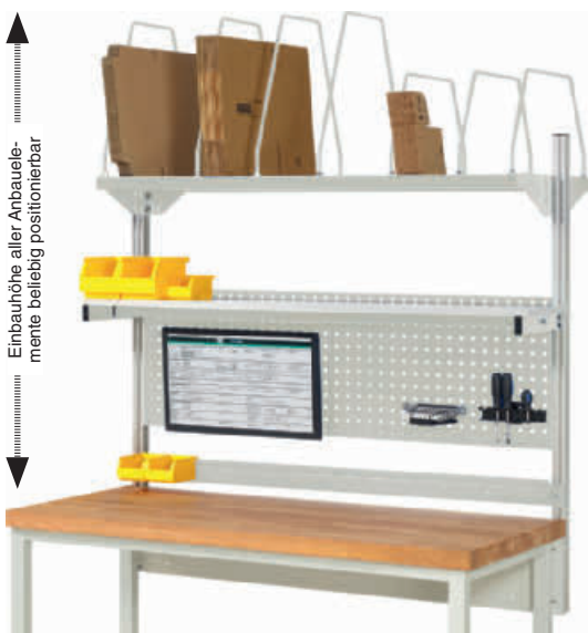
Abbildung zeigt Breite 1500 mm

Einbauhöhe aller Anbauelemente beliebig positionierbar