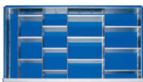
4 Trenn- und 12 Steckwände