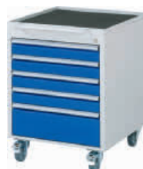
5 Schubladen-L, 4 x 90 mm, 1 x 180 mm