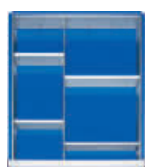
1 Trenn- und 4 Steckwände