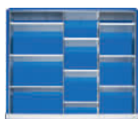
2 Trenn- und 9 Steckwände