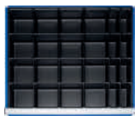
Kleinteileeinsatz mit 24 Fächern (16 x B 128 x T 128 mm, 8 x B 60 x T 128 mm)