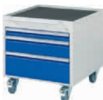
3 Schubladen-L, 1 x 60 mm, 1 x 120, 1 x 180 mm