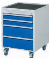
4 Schubladen-L, 2 x 90 mm, 2 x 180 mm