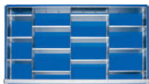
3 Trenn- und 12 Steckwände