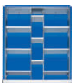
2 Trenn- und 9 Steckwände