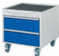
2 Schubladen-L, 2 x 180 mm