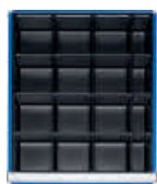
Kleinteileeinsatz mit 16 Fächern (12 x B 128 x T 128 mm, 4 x B 60 x T 128 mm)