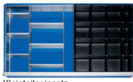
Kleinteileeinsatz mit 16 Fächern (12 x B 128 x T 128 mm, 4 x B 60 x T 128 mm)