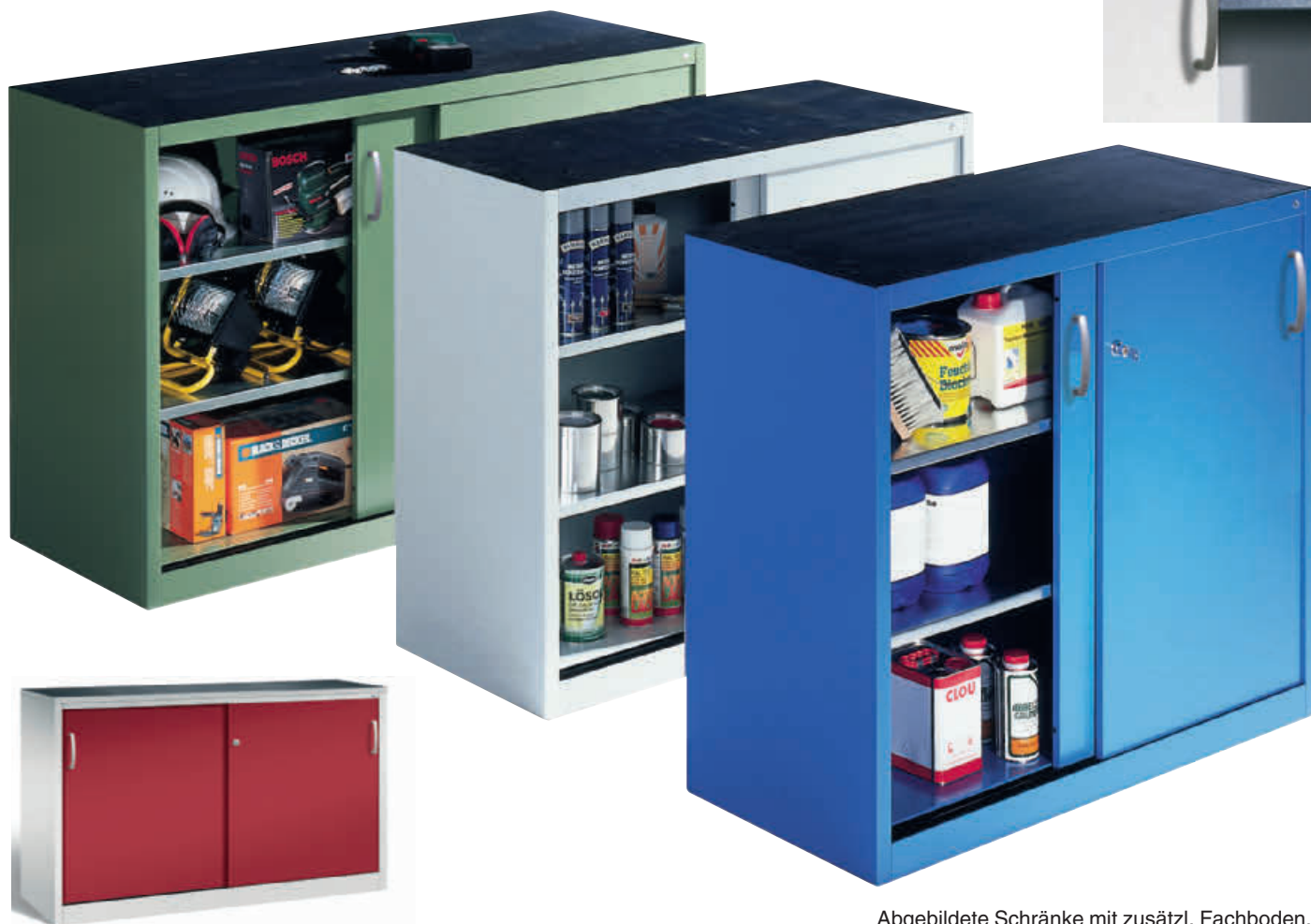
Abgebildete Schränke mit zusätzl. Fachboden, serienmäßig ist jeweils 1 Fachboden enthalten