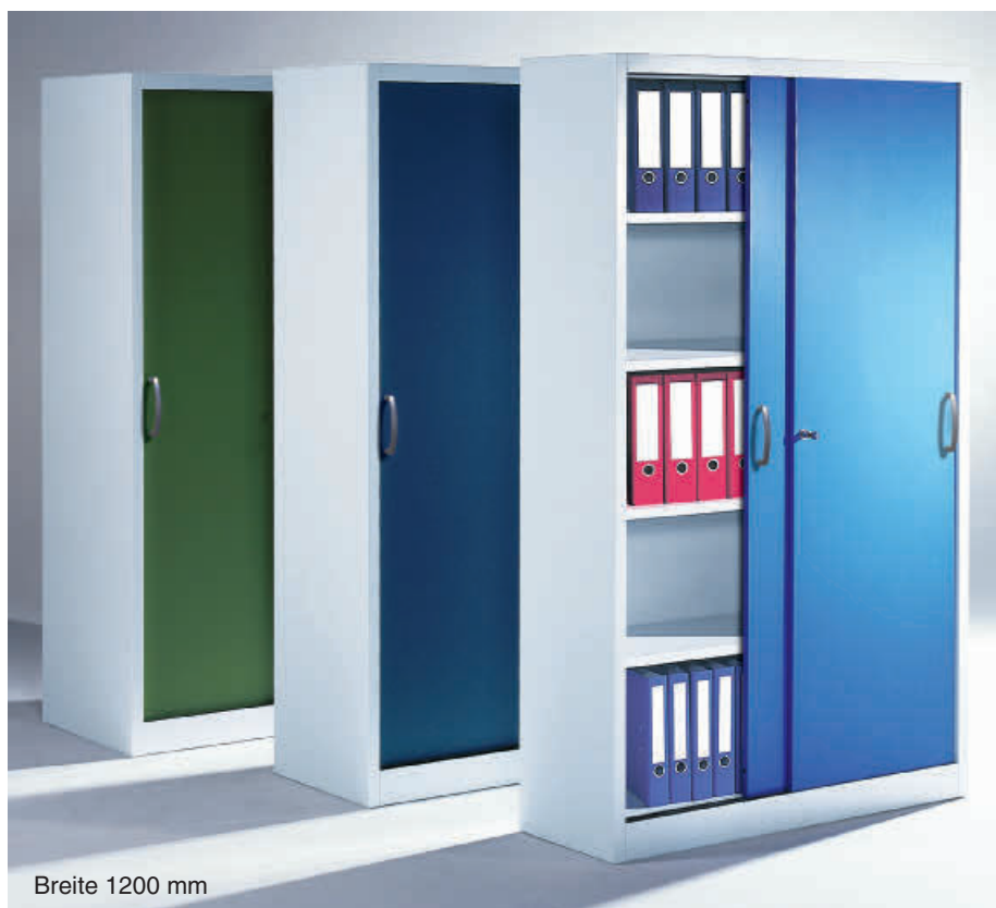
Breite 1200 mm