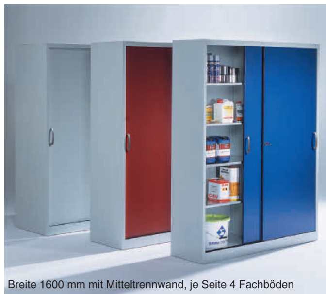
Breite 1600 mm mit Mitteltrennwand, je Seite 4 Fachböden

Fachböden mit Tragkraft 110 kg auf Anfrage.