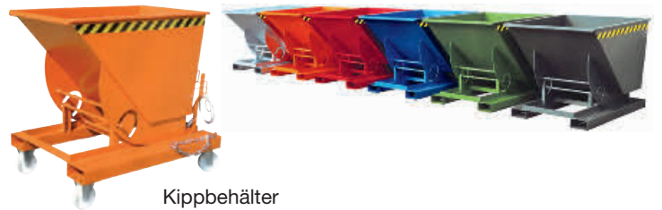
Kippbehälter mit Rollen (Zubehör)