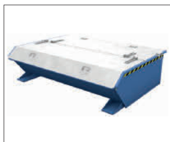
MGU mit Deckel