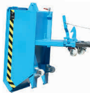
SMGU mit Rollen