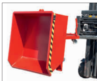
MGU mit Rollen