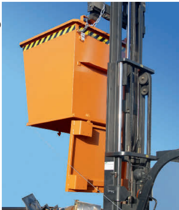
Typ BKB bei Entleerung über Bodenklappe