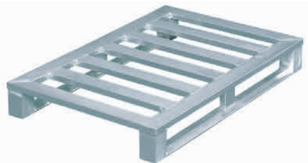
Aluminium-Flachpalette mit Kufen und Eckfüßen