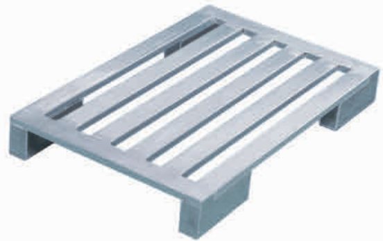
Aluminium-Flachpalette mit langen Eckfüßen