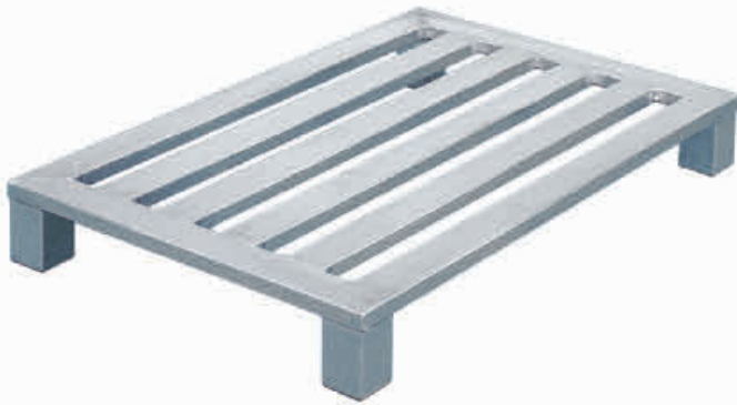
Aluminium-Flachpalette mit 4 Eckfüßen