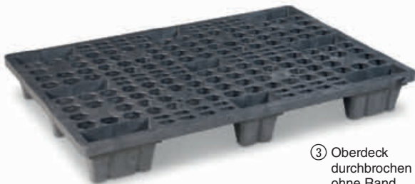
③ Oberdeck durchbrochen ohne Rand