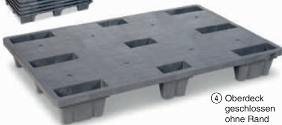
④ Oberdeck geschlossen ohne Rand