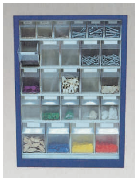
ST P 25 blau