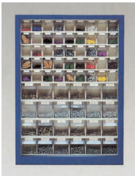
STP 69/M blau