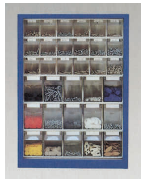
ST P 33 blau