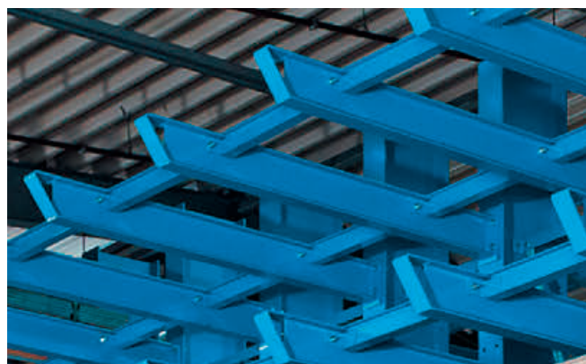
Arm- und Fußbrücken – auf Anfrage