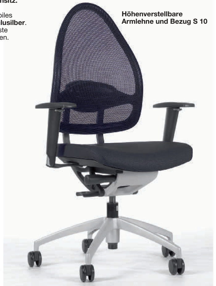
Höhenverstellbare Armlehne und Bezug S 10