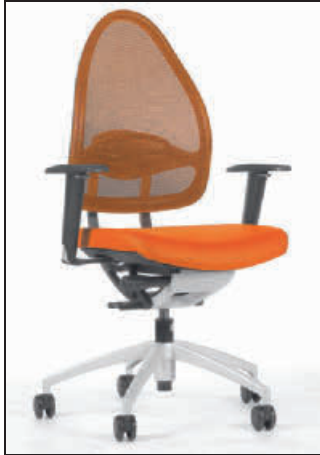
mit höhenverstellbarer Armlehne

Relax-Punktsynchronmechanik zur synchronen Verstellung von Sitz- und Rückenlehne, mit extra großem Öffnungswinkel , individuell auf das Körpergewicht einstellbar.