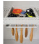
Ablageschale mit Keulenhalter für die praktische Aufbewahrung von Kleinteilen und Keulen