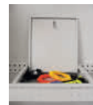
Wertfach abschließbar mit Zylinderschloss