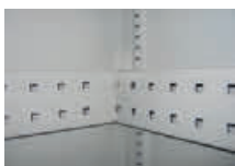
Längstraverse L x B x T: 1164 x 85 x 20 mm (2 Quertraversen nötig)