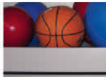
Ballboden pulverbeschichtet, mit Aufkantung