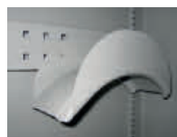
Tauhalter zur Aufbewahrung von Tauen, Seilen, etc.