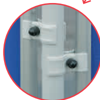
Inkl. 1 Set Befestigungsadapter