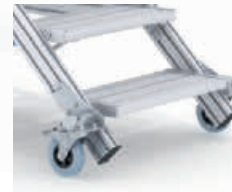
fahrbare Ausführung auf Anfrage