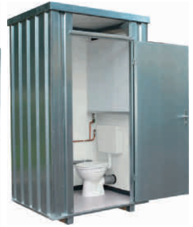
Toilettenbox 2704 mit Frischwassertank

Die robusten, preisgünstigen Mehrzweck-Toilettenboxen sind in Anlehnung an die Richtlinien der Arbeitsstättenverordnung § 48 1.2 gefertigt. Die Mehrzweckbox ist in zwei Varianten lieferbar. Ohne Fenster wird sie gerne von Maschinen- und Anlagenbauern als Gehäuse oder Schutzraum für Schalt- und Bedienungsanlagen eingesetzt. Mit Fenster eignet sie sich zum Beispiel als Kassen-, Pförtner- oder Kontrollstation. Bei den Toilettenboxen ermöglicht der optionale Fäkalien- und Abwassertank die freie Wahl des Aufstellortes unabhängig von einem vorhandenen Entsorgungssystem. Der innenliegende Frischwassertank bei Typ 2704 versorgt Waschbecken und Toilettenspülung auch dort mit Wasser, wo kein direkter Wasseranschluss möglich ist. Die FLADAFI® Toilettenboxen werden als temporäre Lösung sowie als fest installierte kostengünstige Dauerlösung eingesetzt.