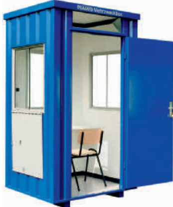
Mehrzweckbox 2706 mit 2 Zusatzfenstern und zusätzlicher Außenwandlackierung