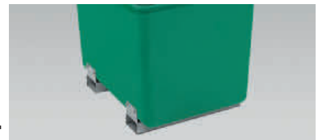
Behälter mit Stapertaschen