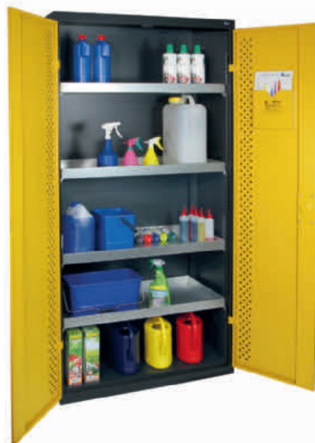
Schrank mit 4 Wannern