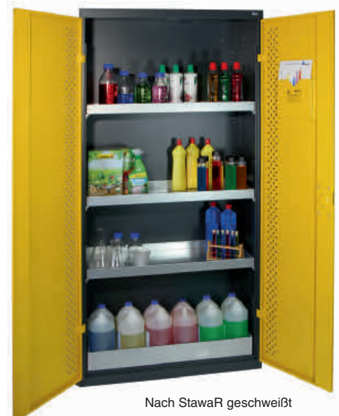
Nach StawaR geschweißte