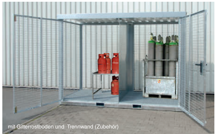
mit Gitterrostboden und Trennwand (Zubehör)