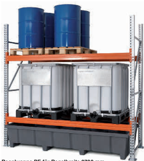
Regalwanne PE für Regalbreite 2700 mm mit Auffangvolumen 1000 Liter