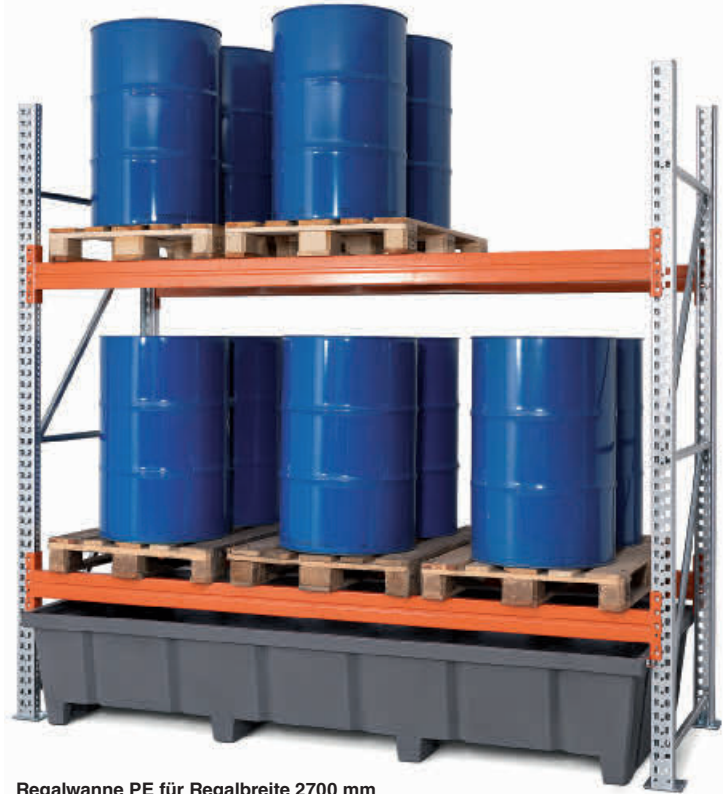
Regalwanne PE für Regalbreite 2700 mm