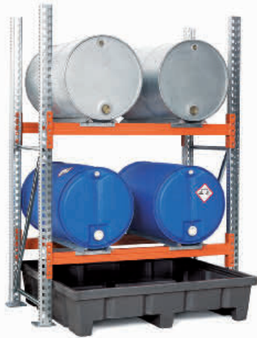
Regalwanne PE für Regalbreite 1400 mm