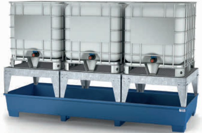
Typ 4 lackiert ohne Gitterrost mit drei Abfüllböcken