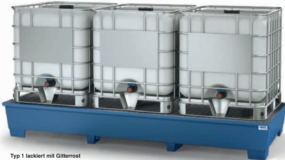
Typ 1 lackiert mit Gitterrost