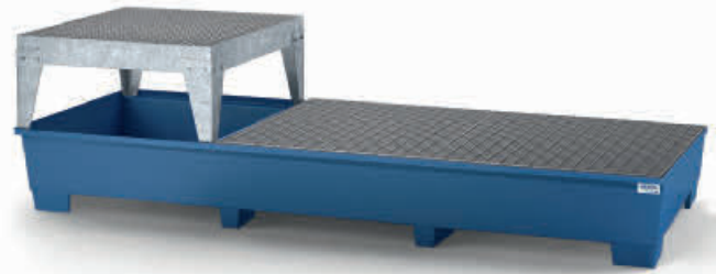
Typ 2 lackiert mit Gitterrost und einem Abfüllbock