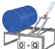
O + Q