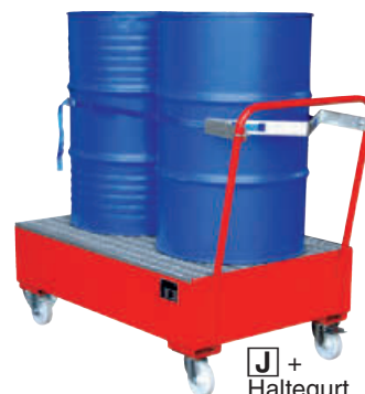
J + Haltegrut