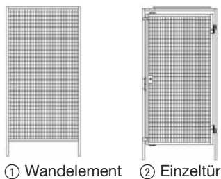
① Wandelement ② Einzeltür

① Wandelemente in 5 Breiten, Höhe 2000 mm, Bodenfreiheit 180 mm