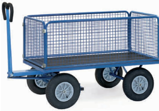
07-01823 – 07-01830