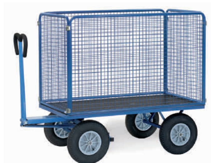
07-01831 – 07-01838